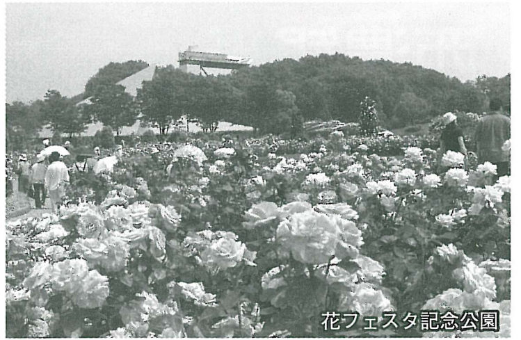
花フェスタ記念公園