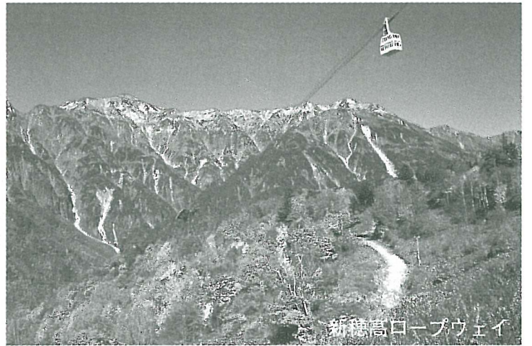
新穂高ロープウェイ